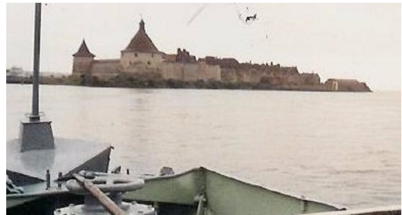
Schlüsselburg am Ausgang des Ladogasees

Aber der Höhepunkt war, nach einer Überfahrt mit dem etwas lotterigen Fährboot über die Newa, der Besuch der Insel Schlüsselburg, wo die Russen während 510 Tagen allen deutschen Angriffen trotzten. In Puskin im Katharinenpalast mit dem Bernsteinzimmer verunmöglichten die vielen Touristen uns fast den Blick auf die einmaligen wieder hervorragend restaurierten Kunstschatze. Dank