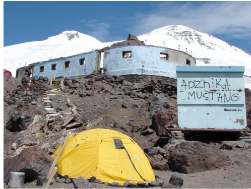
Auf 4200 m Höhe am Fuss des Elbrus 5633, höchster deutscher Stützpunkt im 2. Weltkrieg.

erreichten wir den Kaukasus. Wir fühlten uns wie in der Schweiz. Berge wie im Berner Oberland. Mit Seilbahn, Sessellift und zum Schluss auf einem Rattrac erreichten wir die Höhe von 4200m, direkt unter dem Elbrusgipfel 5633m. Dort kämpften deutsche Gebirgsjäger aus dem Allgäu. Ich werde diese Gefechte in Schnee und Eis auf dieser Höhe meinen 53 Begleiter dieses Jahr schildern!