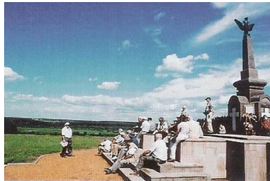
Bei einem der Denkmäler an der Beresina in Weissrussland